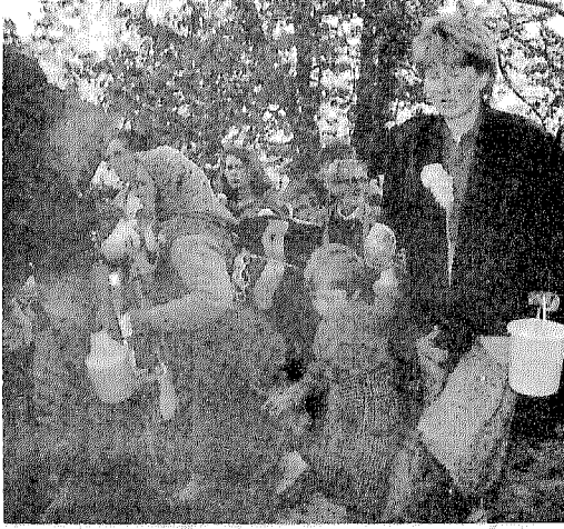
أصبحوا من اللاجئين يتزاحمون على الماء النادر وجوده في البوسنة