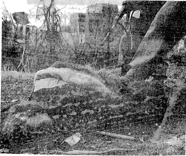
عنوان مجلة «تايم»:

جرائم بلا عقاب وتحت الصورة التي يبدو فيها جندي من الصرب يدوس بقلمه جثة الضحية البريئة: صربي يفرض الإعدام في «فوكوفار».