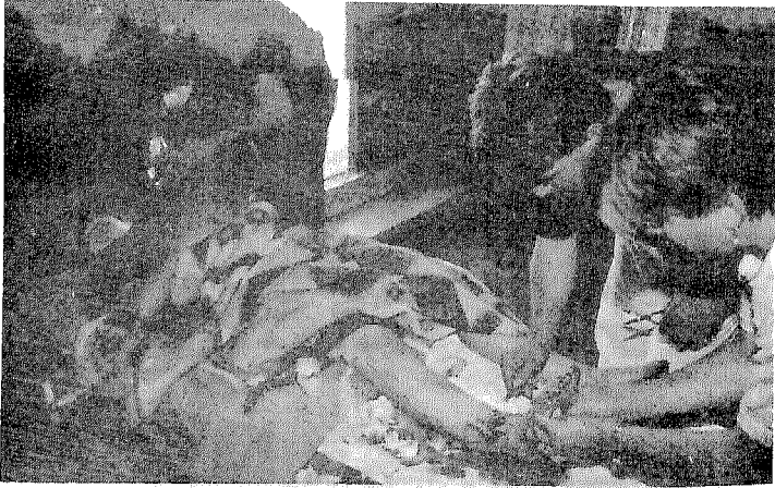
العمليات الجراحية العاجلة تُجرى بدون تخدير!