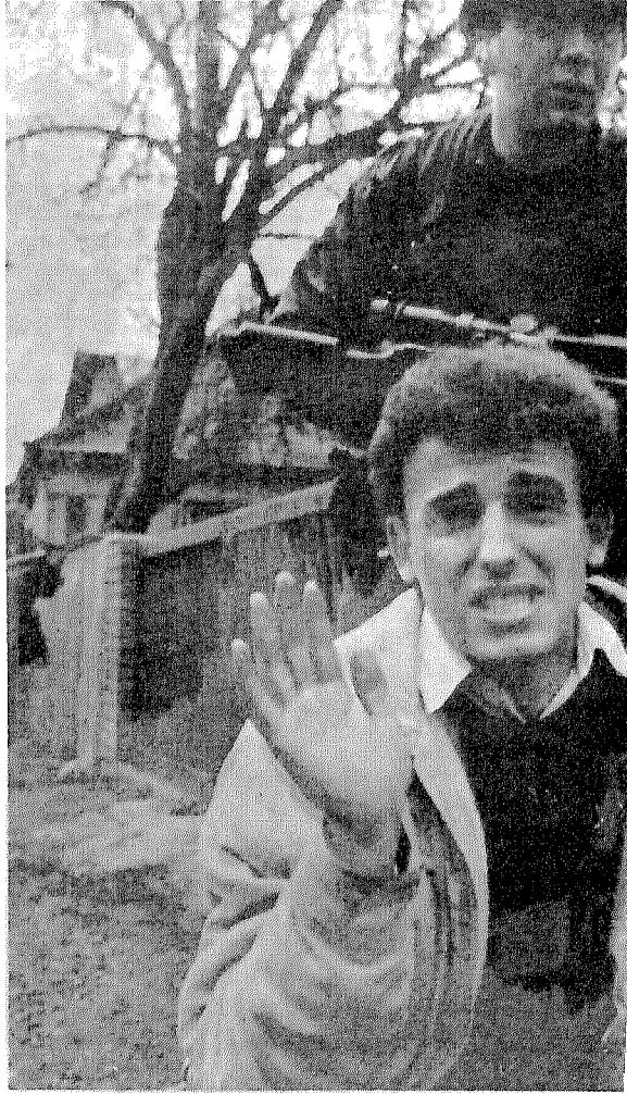
فى مواجهة الموت: هذا الشاب المدينى البوسنى يواجه رصاص «المقاتلين» الصرب، بعد ثوانٍ سيكون فى عداد الشهداء