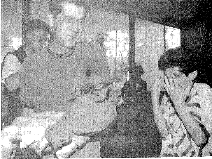
بكاء الأم والأب الذي يحمل طفله المقتول بوحشية