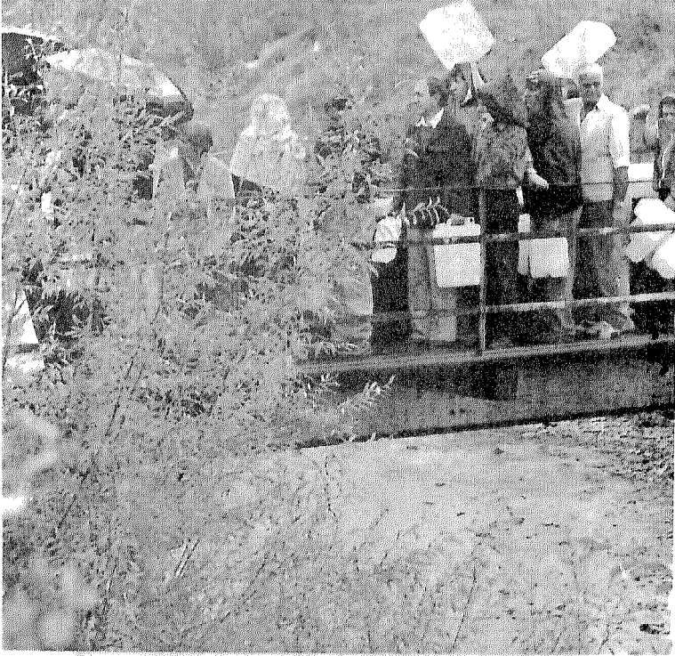
طابور من أهالي البوسنة لإحضار مياه للشرب