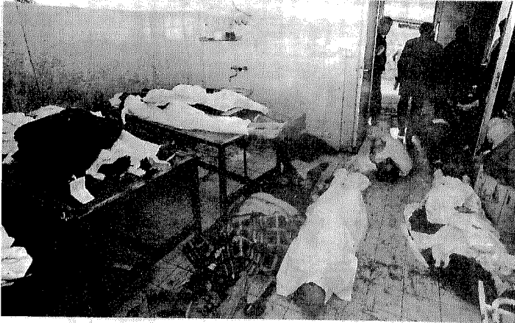
جثث الضحايا الأبرياء من المدنيين المسلمين تتكدس في مشرحة سراييفو التي ضاقت بأعدادها.