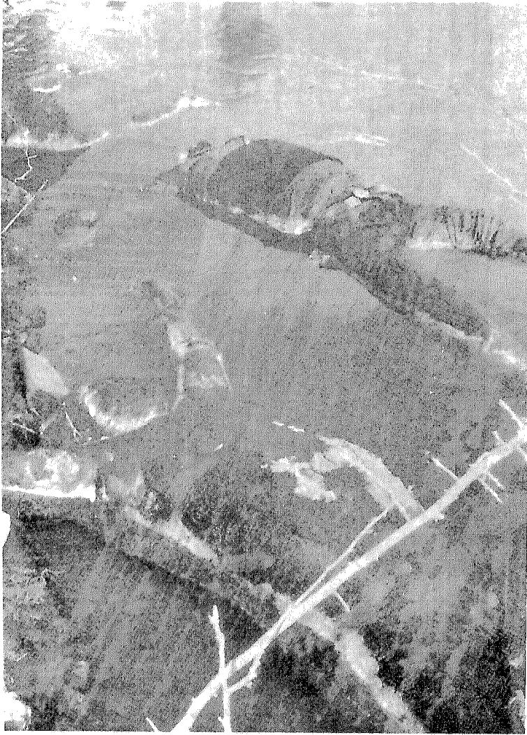
جث الضحايا البوسنيين تلقى في الأنهار حتى تتعفن