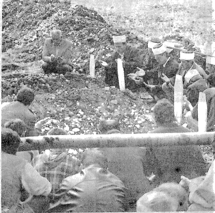
ملعب لكرة القدم في مدينة كوسوفرا تحول بأجمعه إلى مقبرة للشهداء المسلمين بعد أن ازدحمت المقابر بالضحايا