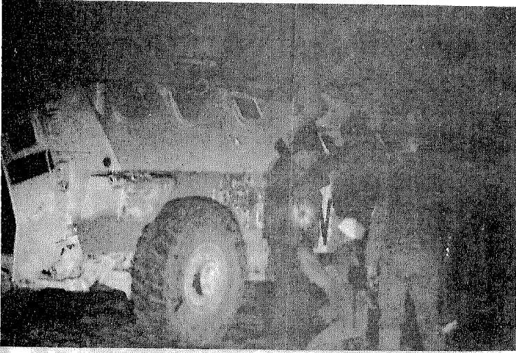
تفتيش البوسنيين العابرين إلى قراهم تحت حماية الأمم المتحدة!